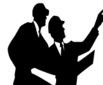
踏査、現地ヒアリング等の調査