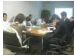
事業主体選定・ファイナンス調整