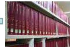
文献等による調査