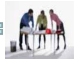
事業化計画策定支援