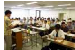
制度・技術・金融に関する講義