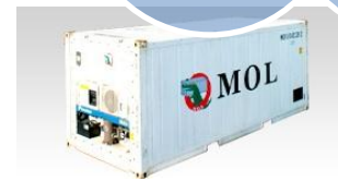
リーファーコンテナ