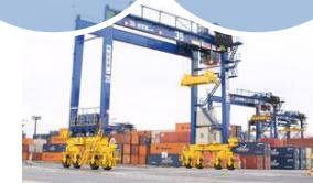
トランスファークレーン