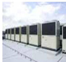
高性能ヒートポンプ 空調（三洋電機HPより）