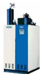
高効率ボイラー