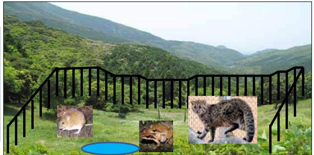
野生順化ケージのイメージ

(年次計画) 平成23年度 測量設計 平成24～25年度 施設整備等 (平成26年度以降 野生順化訓練及び野生復帰)