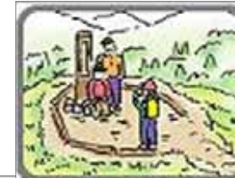
安全対策 (登山道、標識等整備)