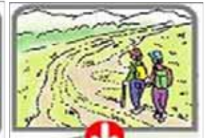
生態系保全のための 整備(植生復元)