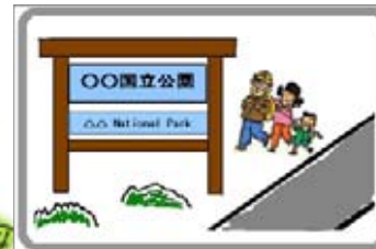
国立公園入口に 標識整備 (多言語化)