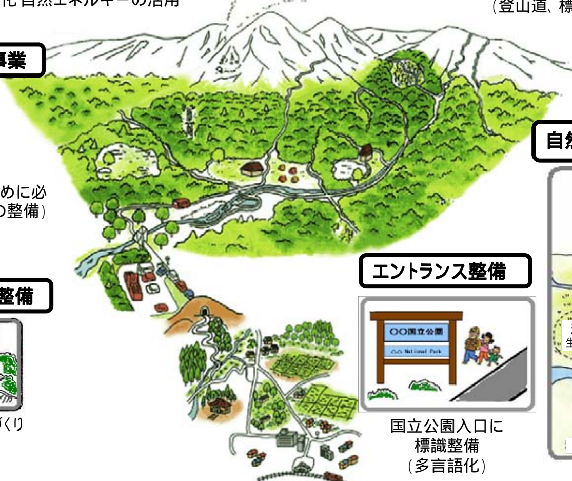
失われた自然等を再生