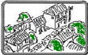
魅力ある温泉地づくり