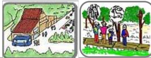
自然情報提供の拠点 自然観察網の整備