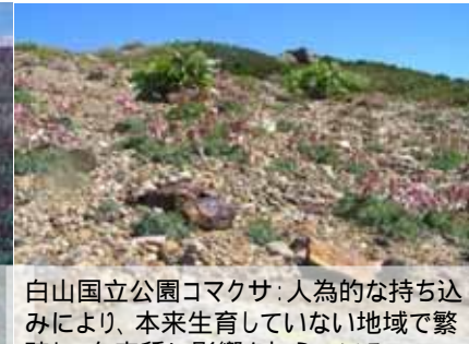
白山国立公園コマクサ: 人為的な持ち込みにより、本来生育していない地域で繁殖し、在来種に影響を与えている。