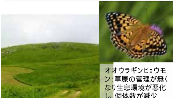
オオウラギンヒョウモン: 草原の管理がなくなり生息環境が悪化し、個体数が減少