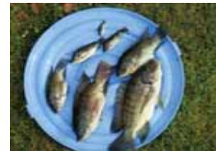
阿寒国立公園ティラピア: オンネトー湯の滝に異常繁殖。