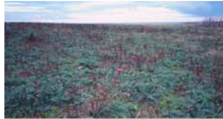
知床国立公園アメリカオニアザミ: 知床岬の草原に高密度で生育し、在来種の生育を妨げている。