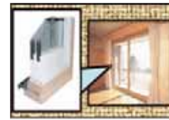
住宅断熱リフォーム