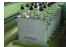
微量PCB混入廃棄物の処理促進