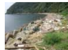
漂流・漂着ゴミの回収・処理