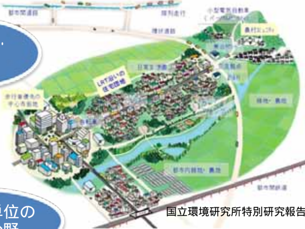
国立環境研究所特別研究報告SR-79-2008