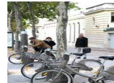
コミュニティサイクル