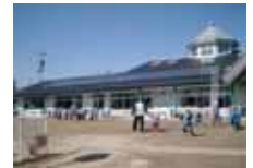
市民出資による太陽光パネル設置