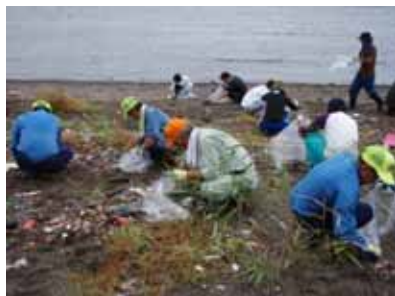
地域の関係者等連携した漂着ゴミのモニタリング

第二十二条 国及び地方公共団体は、海岸漂着物等の発生の抑制を図るため必要な施策を効果的に推進するため、定期的に、海岸漂着物等の発生の状況及び原因に関する調査を行うよう努めなければならない。