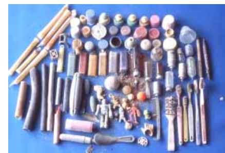
太平洋地域の海鳥のヒナ3羽の死骸から発見されたゴミ