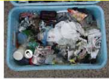
回収された海中ごみ