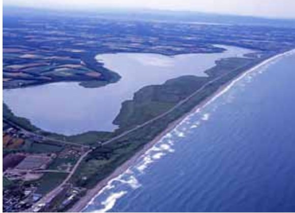
瀧沸湖：平成17年11月、ラムサール条約湿地に登録

多くの生きものの生息地であり、生活環境を支える重要な生態系である湿地から、人と生きものが互いに恵みを得られるよう、保全・再生を図る。