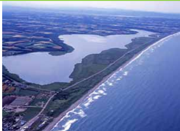
瀧沸湖：平成17年11月、ラムサール条約湿地に登録

多くの生きものの生息地であり、生活環境を支える重要な生態系である湿地から、人と生きものが互いに恵みを得られるよう、保全・再生を図る。