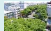
風の通り道や地域冷暖源となる緑地の確保