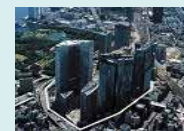
再開発を機とした地域冷暖房の導入