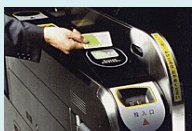
ICカード導入とCO2削減量の見える化による公共交通機関の利用促進