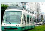
トランジットモールやパークアンドライドの導入