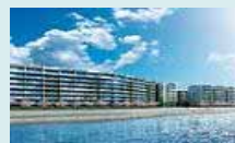
太陽熱供給システムを導入した集合住宅の整備