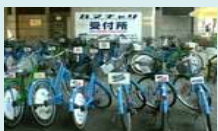
コミュニティ・サイクルやカーシェアリングの導入