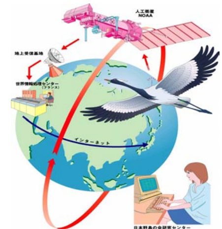
人工衛星による鳥類の移動追跡の仕組み