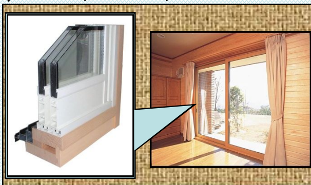
↓断熱資材(複層ガラス)

・住宅リフォーム時における建物全体への高効率断熱材などの断熱資材の導入や、高効率空調システム等を大規模に導入する事業を大規模に導入する。