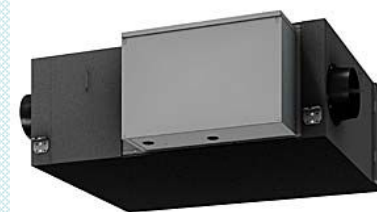
↑高効率空調システム