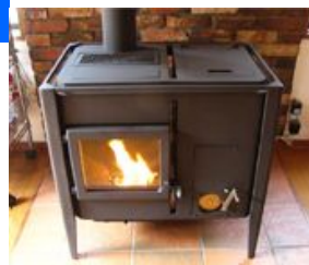
→ 木質ペレットストーブ

・家庭等で利用可能な木質ペレットなどのバイオマス燃料の燃焼機器を地域にまとめて導入する。