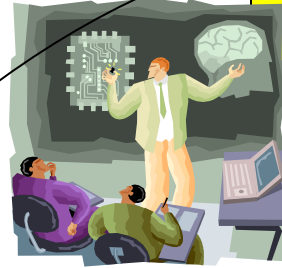
最新の知見・技術