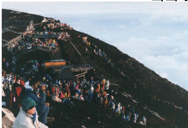
特定の山岳地に利用が集中