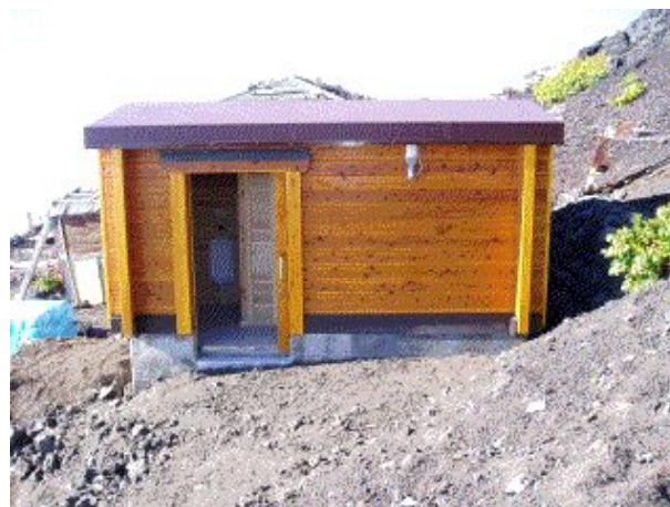
補助による山岳トイレの整備 (オガクズ式し尿処理施設)