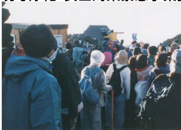
トイレの使用は順番待ち