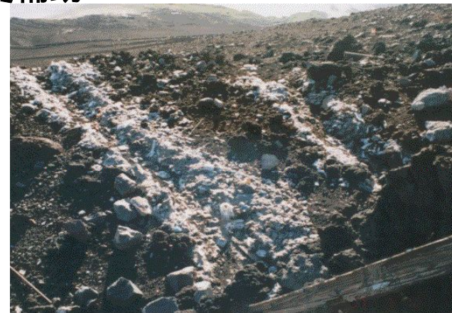
山岳地のトイレは未処理で放流 (白い堆積物は未分解のトレットペーパー)