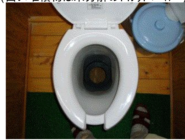
オガクズ式トイレの内部