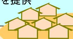
複数の家庭(世帯)で構成される団体