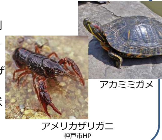
アメリカザリガニ 神戸市HP

外来種の中には、国内で蔓延又はその恐れのあるものの、様々な背景により外来生物法に基づく飼養等の規制が困難な種が存在する。例えば、広く一般家庭で飼育されており指定により放逐が増大する、交雑個体が多いが肉眼で見分けがつかず、規制をかけることにより法の適正な執行に混乱を生ずる、等である。また、H28～30年度にこのような特徴をもつアカミミガメをモデルに検討を行ったが、同種の駆除に伴いアメリカザリガニが増加する等、同じ場所で複数の外来種が生息する場合、ある種を駆除すると他の種が勢いを増す等、単純な対応では固有の生態系を維持できないことが指摘された(種間相互作用)。これらの種について生息状況や影響等の把握、種間相互作用を加味した防除手法の確立、交雑種の判定手法の確立が必要である。また、遺棄防止対策等を含めた総合的な対策の対応が必要である。