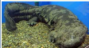
チュウゴク オオサンショウウオ 神戸大学HP