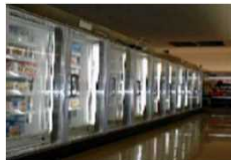
＜冷凍冷蔵ショーケース＞