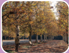
⑤モミジバスズカケノキ (プラタナス並木)