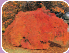
⑦タムケヤマ(カエデ)