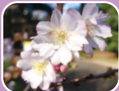
①ジュウガツザクラ

11月下旬からはイチョウやカエデが赤や黄色に色づきます。秋の御苑をあでやかに彩る木々の紅葉をお楽しみください。(数字は表面、地図の花位置に対応しています)