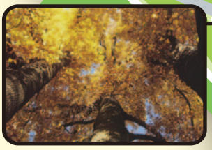
2008新宿御苑 フォトコンテスト入賞作品 「黄色の世界」