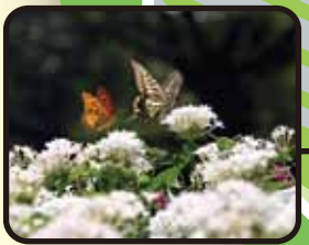
2009新宿御苑 フォトコンテスト入賞作品 「花から花へ」

○ ..... 季節の花 ● ..... 季節の実 (印の色は花や実の色の目安) ※花期は裏面の花ごよみをご参照ください 数字は裏面、花や実の写真に対応