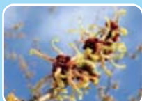
マンサク(マンサク科)