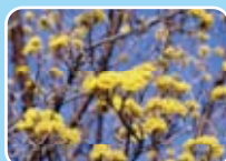
サンシュユ(ミズキ科)