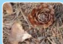
ヒマラヤスキの松ぼっくり(マツ科)