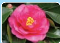
カンツバキ(ツバキ科)

早春の園内に、ふわりと甘い香りをただよわせるウメの花。園内各所に約350本が植栽されています。ウメのつぼみがほころびはじめると、もうすぐそこまで春が来ています。 (バラ科)