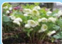
クリスマスローズ(キンポウゲ科)