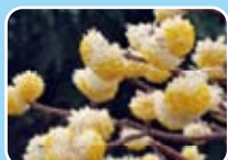
ミツマタ(ジンチョウゲ科)