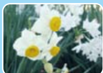
ニホンズイセン(ヒガンバナ科)