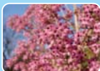
ジャノメエリカ(ツツジ科)