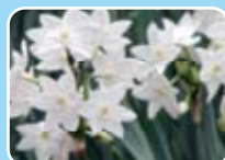
スイゼン"ペーパーホワイト"(ヒガンバナ科)