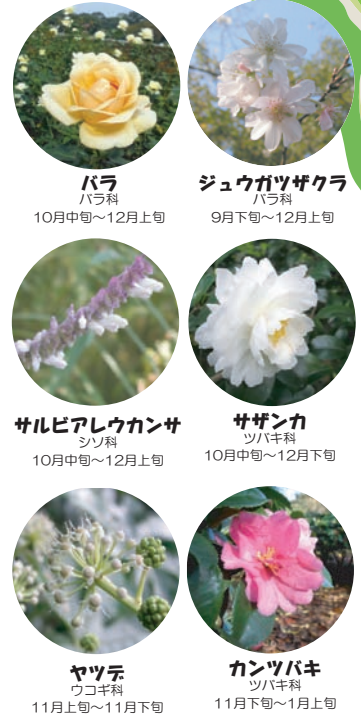
バラ バラ科 10月中旬～12月上旬 ジュウガツザクラ バラ科 9月下旬～12月上旬 サルビアレウカンサ シソ科 10月中旬～12月上旬 サザンカ ツバキ科 10月中旬～12月下旬 ヤツテ ウコギ科 11月上旬～11月下旬 カンツバキ ツバキ科 11月下旬～1月上旬