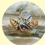
セグロアシナガバチ