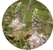
ツルボ ユリ科 8月中旬～9月中旬