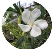
キョウチクトウ キョウチクトウ科 6月中旬～8月下旬