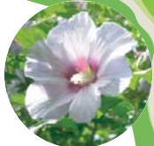
ムクゲ アオイ科 6月下旬～9月上旬