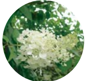
ミナツキ ユキノシタ科 7月下旬～8月中旬