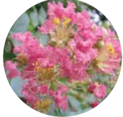
サルズベリ ミソハギ科 7月下旬～9月下旬