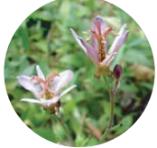
台湾ホトトギス ユリ科 8月下旬～11月上旬