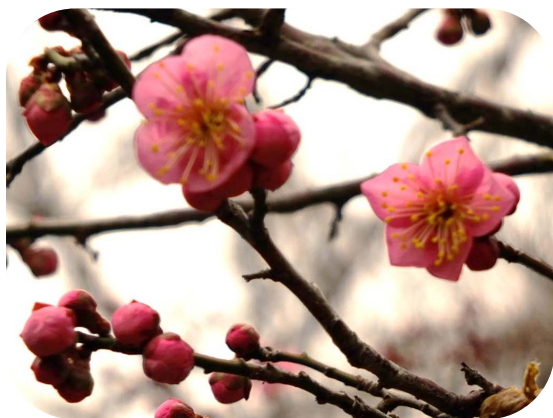
紅梅・白梅 (出水の小川)

✿ ジュウガツザクラ Autumnalis ( Cerasus × subhirtella (Miq.) Masam. & Suzuki 'Autumnalis')