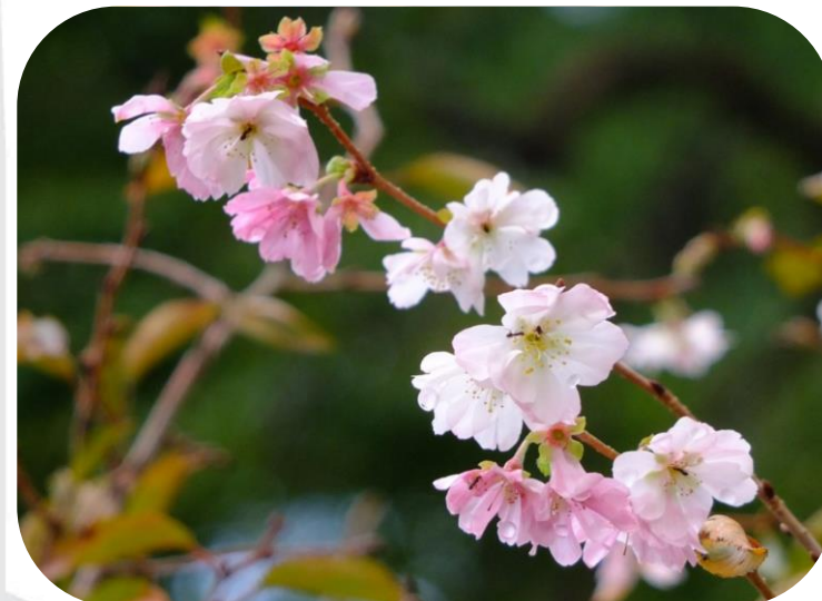
ジュウガツザクラ(出水の小川東)

ジュウガツザクラAutumnalis ( Cerasus × subhirtella (Miq.) Masam. & Suzuki 'Autumnalis')