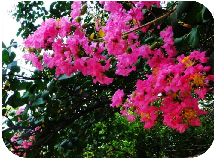
サルスベリ (富小路広場東)