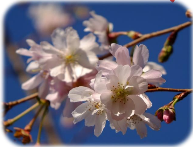
ジュウガツザクラ

秋から春まで咲き続けるジュウガツザクラがたくさん花をつけています。 木々の合間にはサザンカの様々な色が映えています。 寒い季節の花々をお楽しみください。