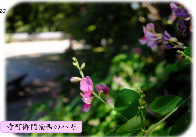
寺町御門南西のハギ