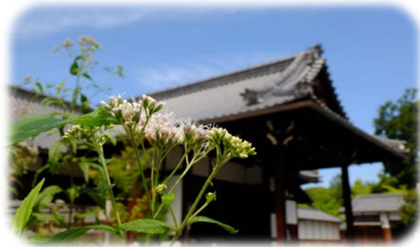
閑院宮邸跡のフジバカマ

サルスベリ(百日紅) フジバカマ(藤袴) ハギ(萩) ● Lagerstroemia indica ● Eupatorium japonicum ● Lespedeza