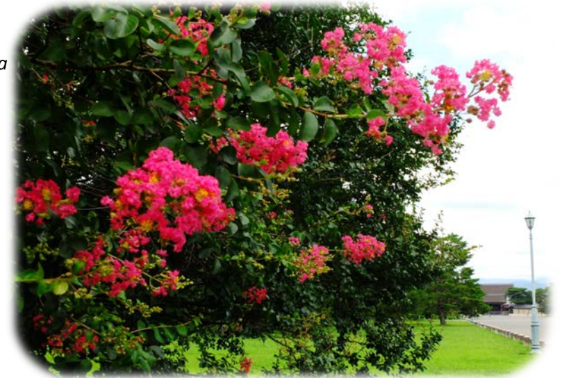
堺町休憩所北のサルスベリ