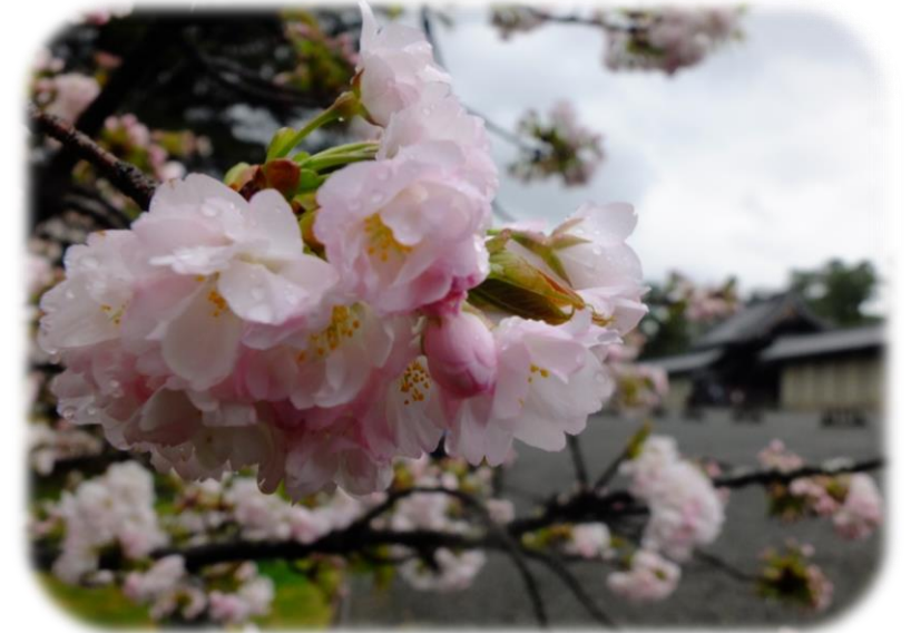
車返桜(中立売御門東)