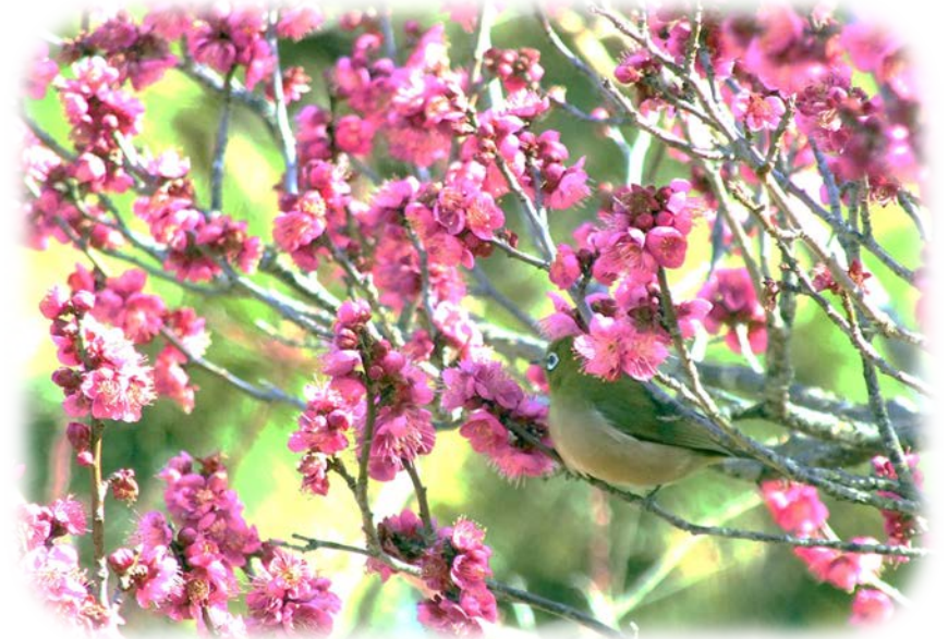
梅林の紅梅とメジロ