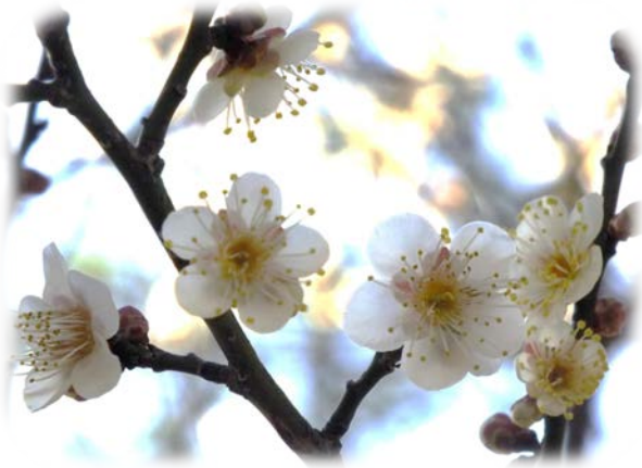
堺町休憩所北の白梅