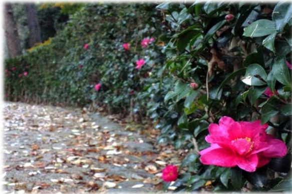
京都迎賓館南側 サザンカ生垣

晩秋の名残の紅葉に加え、サザンカの花が続く季節を彩ります。冬鳥たちの声がにぎやかに聞こえてきます。秋から冬へ、季節の変化をお楽しみ下さい。