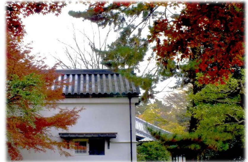
閑院宮邸跡の紅葉