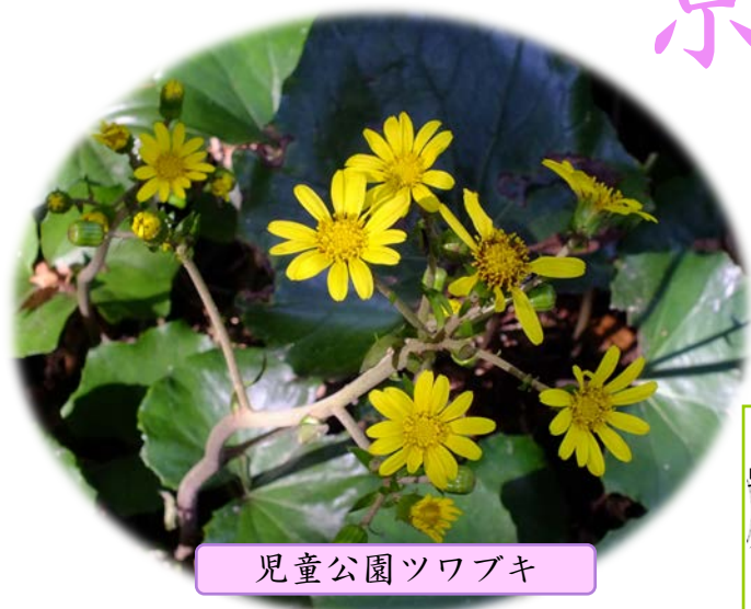
児童公園ツワブキ

コムラサキが艶やかに色づきました。 足元ではツワブキが鮮やかに咲き始め、秋の散歩を楽しくしてくれます。 御苑の秋を満喫してください。