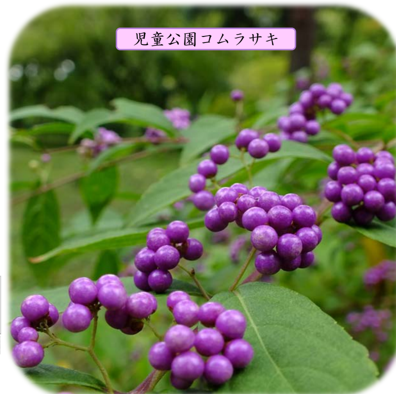
児童公園コムラサキ

● ツワブキ Farfugium japonicum ● コムラサキ Callicarpa dichotoma