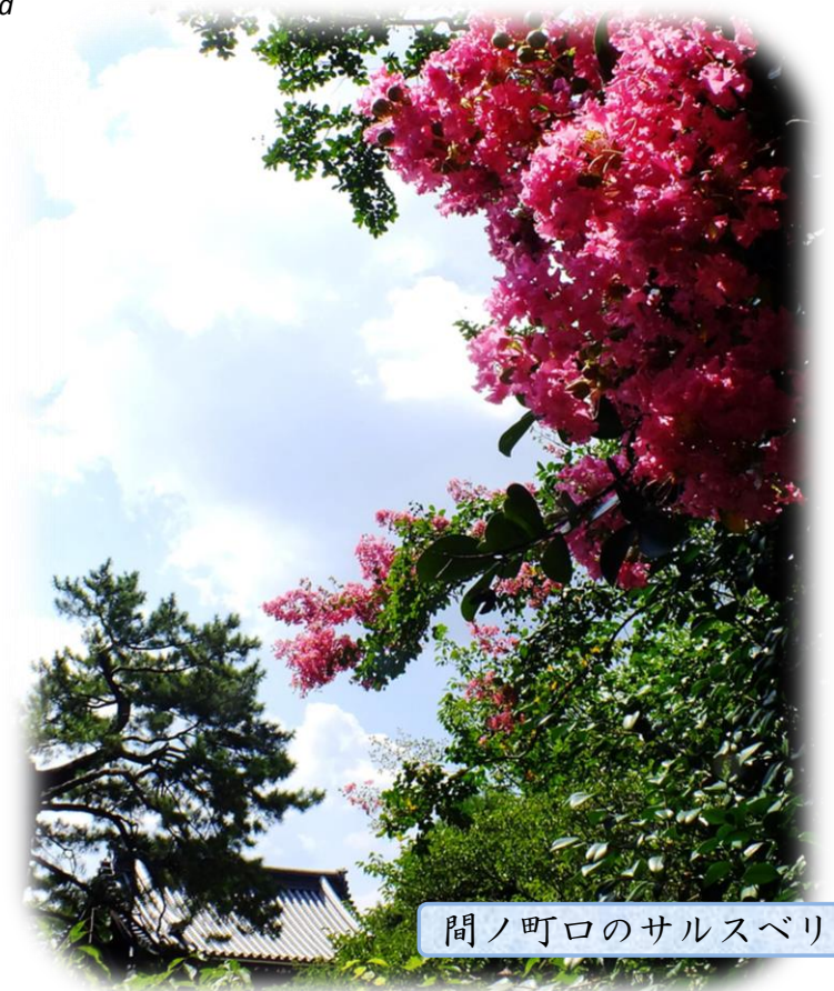
間ノ町口のサルスベリ