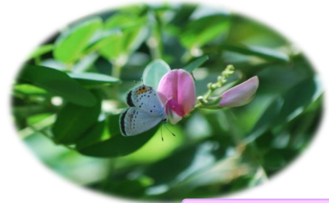
ハギの花とツバメシジミ