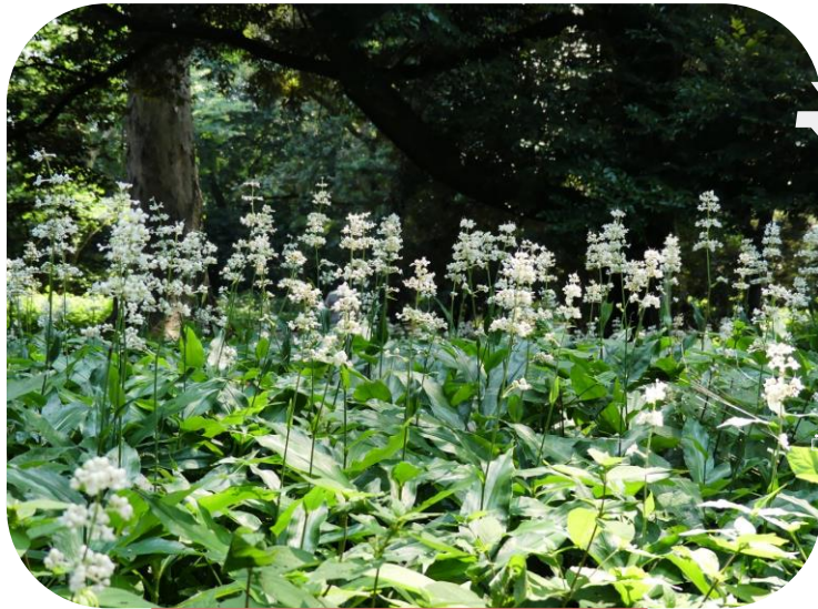
ヤブミョウガ(迎賓館東)