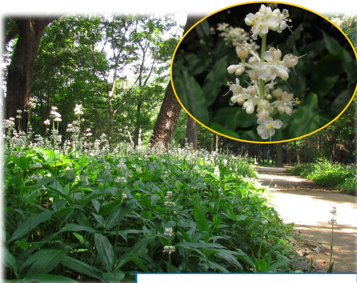
ヤブミョウガ (迎賓館東)