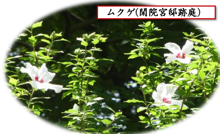
ムクゲ(閑院宮邸跡庭)

漢字で書くと「百日紅」。7月～10月の長期にわたって花が咲き続ける事が由来です。