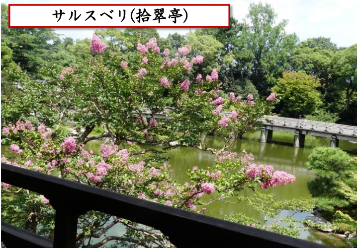
サルスベリ(拾翠亭)

漢字で書くと「百日紅」。7月～10月の長期にわたって花が咲き続ける事が由来です。