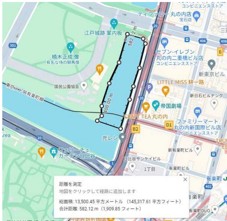
図 5 日比谷濠 (13,500 m 2 )