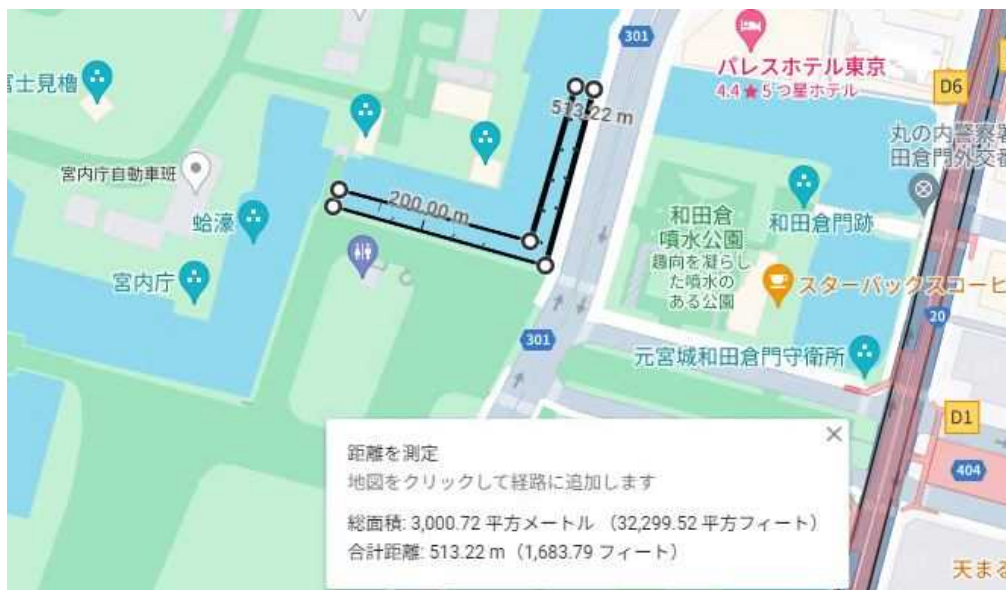
図3 桔梗濠(桔梗門周辺 3,000 m 2 )