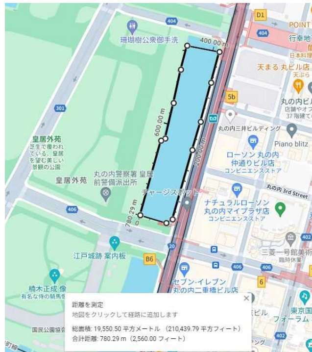
図 4 馬場先濠 (19,550 m 2 )