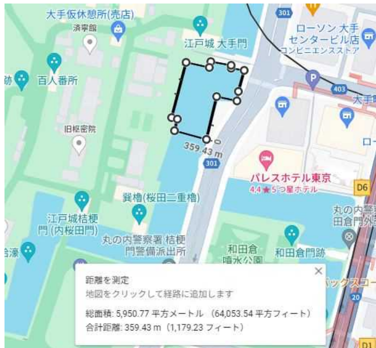
図2 桔梗濠(大手門周辺 5,950 m 2 )