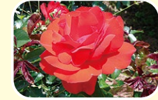
4 장미 (5월 6월 7월)