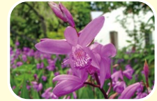
3 자란 (5월 6월 7월)