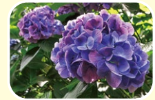
11 수국 (5월 6월 7월)