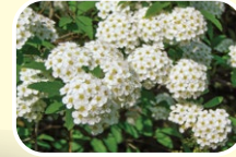
1 공조팝나무 (5월 6월 7월)