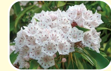
6 갈미아 (5월 6월 7월)