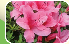
8 영산홍 (5월 6월 7월)