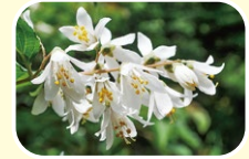
7 빈도리 (5월 6월 7월)