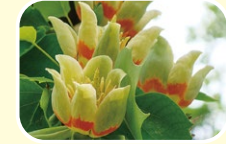
2 튜올립나무 (5월 6월 7월)