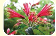
5 알스트로메리아 (5월 6월 7월)