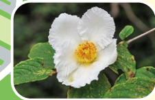
10 노각나무 (5월 6월 7월)