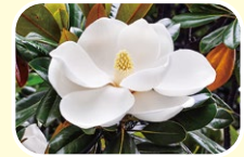
9 태산목 (5월 6월 7월)