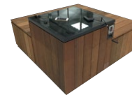
시티차지 (스마트폰 태양광 충전 스탠드)