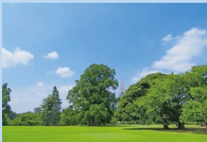
영국 풍경식 정원

공원내에는 풍경식 정원, 정형정원, 일본정원, 이 세가지 정원이 서로 조화되게 디자인되어 메이지시대를 대표하는 근대식 서양정원입니다.