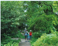
cool off spot English Only

신주쿠 교엔은 도심지에 있으면서도 시가지에 비해 1~3°C정도 기온이 낮아지는 "쿨 아일랜드 현상"이 일어난다고 여겨집니다. 도시에 시원한 공기를 공급하는 등의 기능이 기대됩니다.