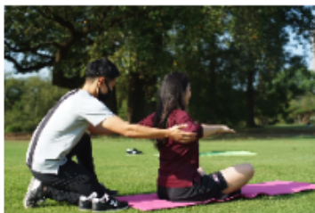
パーソナルストレッチ