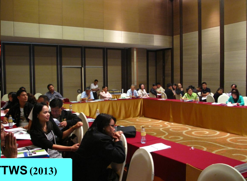
11 th TTWS (2013)