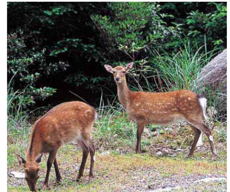
Yaku sika deer Cervus nippon yakushimae