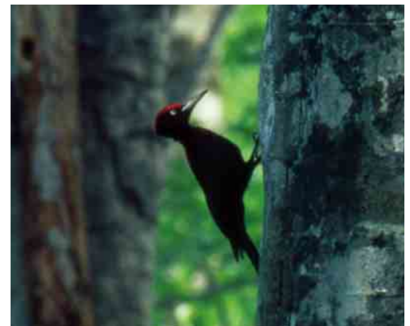
Black woodpecker Dryocopus martius