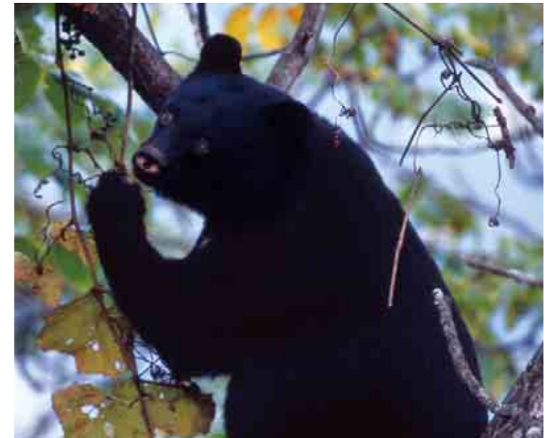
Asiatic black bear Ursus thibetanus