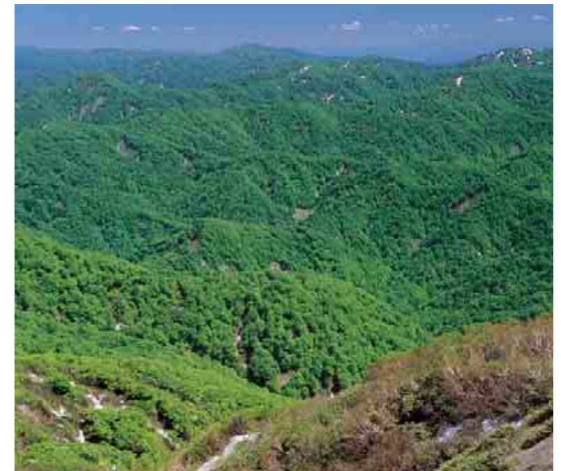
A fresh green origin part