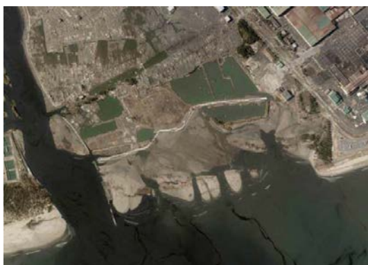
GAMOUHIGATA after the disaster 震災後の蒲生干潟

The itinerary might be changed due to bad weather. コースについては、天候等により変更する場合があります。 Bring raingear when forecast is not good. 雨などが想定される場合、雨具を持参してください