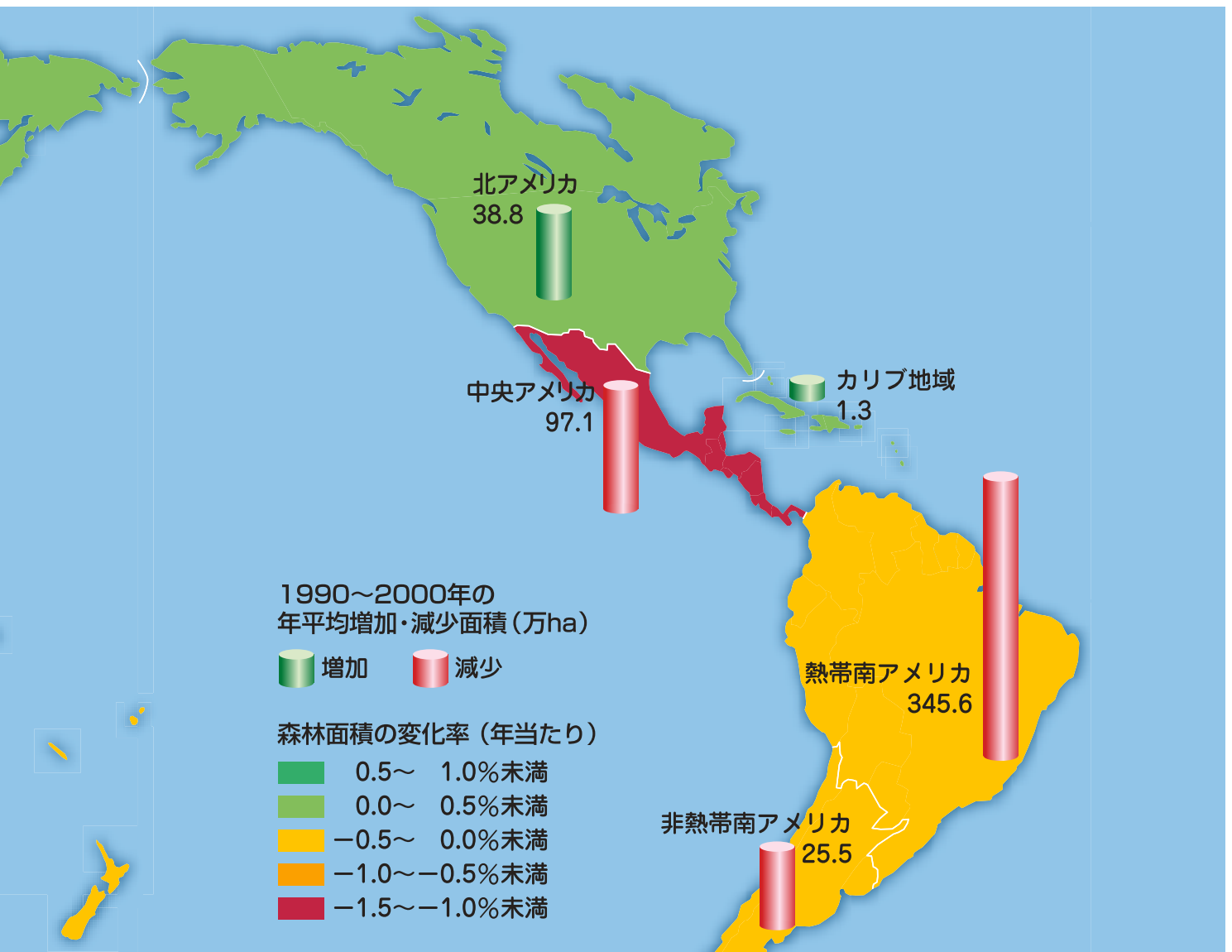
図1、図2、図4は「Global Forest Resources Assessment 2000」(FAO,2001年)をもとに作成